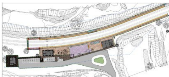
Fig. 5.4.15. Estação de Almendra